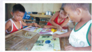
ろうきんギャラリー心齋橋で行われた「儲けないミニ緑日」では、20,235円の募金協力がありました。それらはミニ図書館設置のための図書や教育玩具の購入に使わせていただきました。

近畿ろうきん本店営業部・推進委員会からいただいた3万円のご寄付により、55人が半年使用する文房具を購置させていただきました。