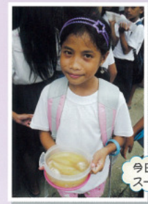
今日のおかずは鶏肉と瓜のスープ、おいしー!