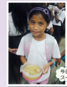
今日のおかずは鶏肉と瓜のスープ、おいしー!