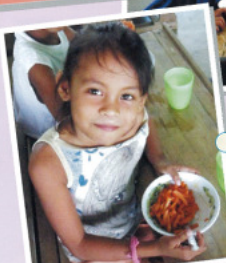
給食の時間がいつも楽しみ!