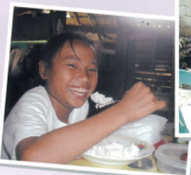
野菜とマカロニがたっぷりはいったスープも人気のメニュー。