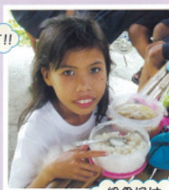
給食には、お米、野菜、肉または魚が必ず入っています。