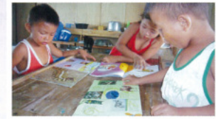
ろうきんギャラリー心齋橋で行われた「儲けないミニ緑日」では、20,235円の募金協力がありました。それらはミニ図書館設置のための図書や教育玩具の購入に使わせていただきました。

近畿ろうきん本店営業部・推進委員会からいただいた3万円のご寄付により、55人が半年使用する文房具を購置させていただきました。