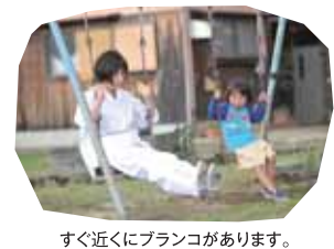
創麺屋の外観 香川県小豆郡小豆島町 木庄甲226-2 0879-82-5790 すぐ近くにブランコがあります。

瀬戸内海に浮かぶ小豆島(香川県)へ 小豆島は、四国の玄関口・香川県高松市よりフェリーで約1時間の瀬戸内海に浮かぶ島。オリーブ栽培や醤油、そうめんなどの生産が盛んで、農村歌舞伎や島四国八十八ヶ所など、古くからの島固有の文化が広がっています。映画の中で希和子が薫(恵理奈)と幸せな日々を過ごし、癒されていく場所です。